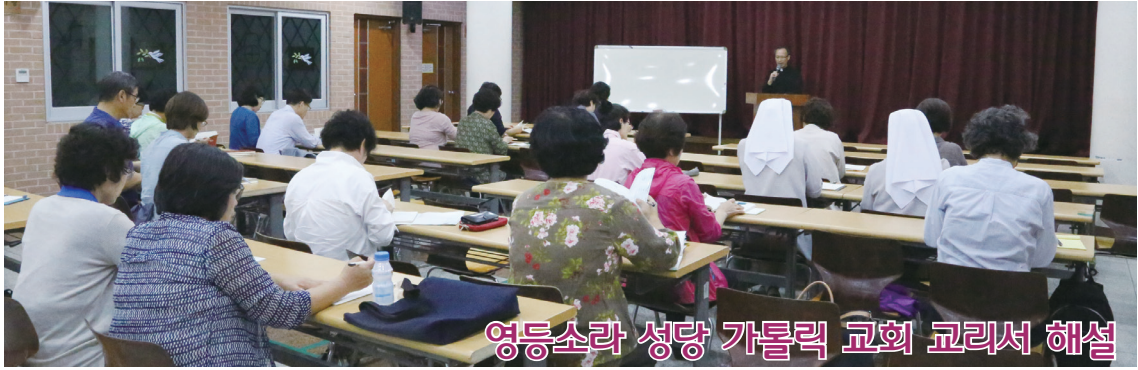
영등소라 성당 가톨릭 교회 교리서 해설